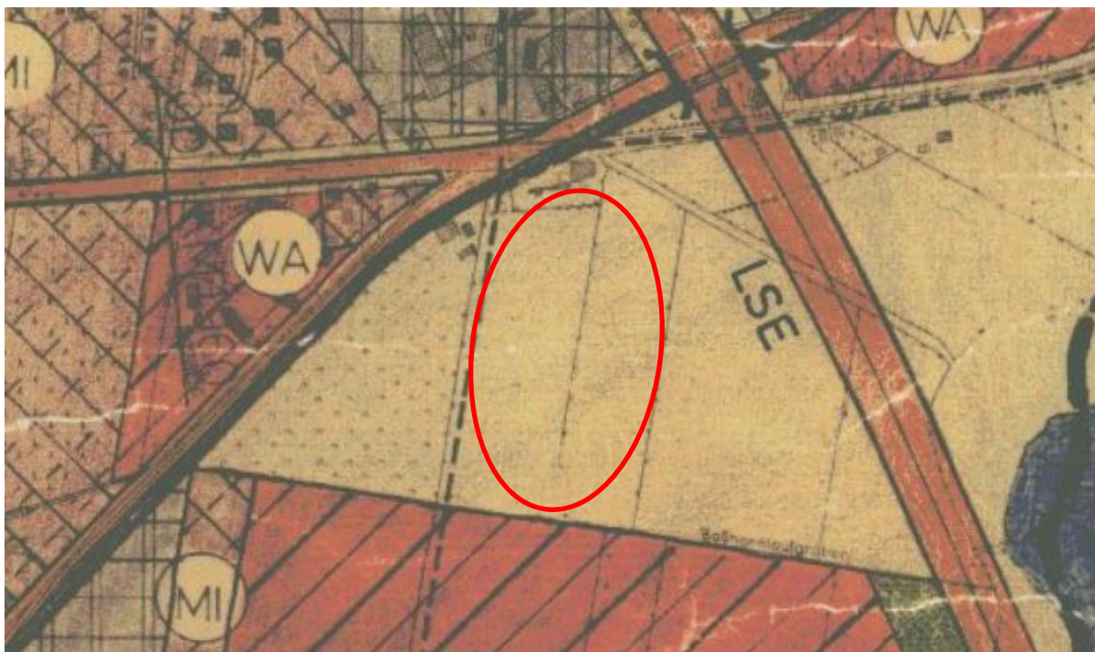
Abb. 4: Ausschnitt aus dem wirksamen FNP mit Lage des Plangebietes, ohne Maßstab