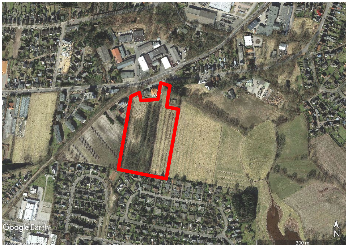
Abb. 1: Luftbild mit Lage des Geltungsbereichs der 53. Änderung des Flächennutzungsplanes, ohne Maßstab, Quelle: Google Earth 2018 / GeoBasis-DE/BKS 2009