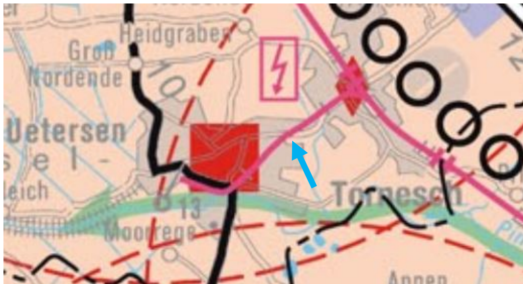
Abb. 2: Ausschnitt aus dem Landesentwicklungsplan Schleswig-Holstein 2010 mit Kennzeichnung des Plangebiets (blauer Pfeil), ohne Maßstab

Aufgrund der Funktion als Unterzentrum mit einer guten infrastrukturellen Anbindung an weitere zentrale Orte entspricht eine bauliche Entwicklung in Uetersen den Zielen des LEP.