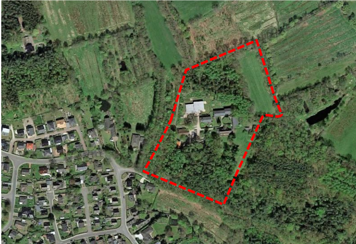
Abbildung 1: Luftbild mit Lage des Plangebiets (rote Umrandung), genordet, ohne Maßstab (Quelle: Google Earth, 2018, © 2009 GeoBasis-DE/BKG).