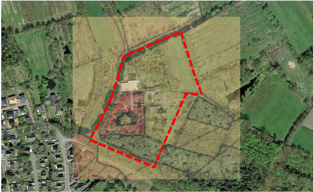
Abbildung 4: Luftbild mit Lage des Plangebiets (rote Umrandung), genordet, ohne Maßstab (Quelle: Google Earth, 2018, © 2009 GeoBasis-DE/BKG und Landkreis Pinneberg).