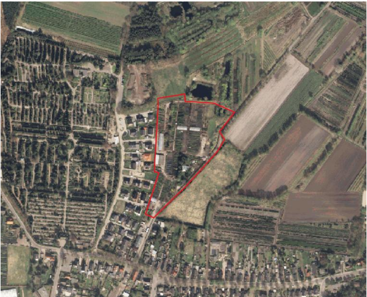
Abbildung 1 - Luftbild mit Änderungsbereich (ohne Maßstab)

Das Areal selbst wird derzeit landwirtschaftlich genutzt (Baumschule). Die hier vorhandenen Gebäude wurden im Rahmen dieser Nutzung errichtet.